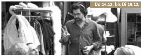
Do 14.12. bis Di 19.12.

Grandiose Satire über die Filmindustrie, die Machtkämpfe hinter den Kulissen und die Hoffnungen eines gescheiterten Schauspielers. Für ihren ersten Fernsehfilm sucht Regisseurin Vera die Idealbesetzung. Kurz vor dem ersten Drehtag hat sie die Hauptrolle immer noch nicht gefunden. Produzent und Team verzweifeln, doch Gerwin freut sich: Er verdient sein Geld als Proben-Anspielpartner und spricht Dialogsätze für die prominenten Bewerberinnen ein, die eigentlich alles andere nötig haben, als sich einem Casting zu stellen. Der Film blickt äußerst lässig, direkt, klug und unterhaltsam auf diese unsere Welt, in der Selbstvermarktung zum Alltag geworden ist.