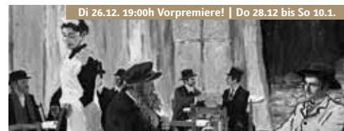
Di 26.12. 19:00h Vorpremiere! | Do 28.12 bis So 10.1.

Dieser Animationsfilm ist ein visuell berauschendes Meisterwerk, dessen Farbenpracht und Ästhetik noch lange nachwirken.