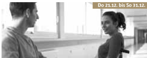
Do 21.12. bis So 31.12.

Eine humorvolle und einfühlsame Geschichte über Freundschaft mit grandiosen Nachwuchsdarstellern und treibenden Hip-Hop-Beats. Ein Unglück verändert das Leben eines jungen Mannes radikal. Aus einem angehenden Sportlehrer wird ein Pflegefall, der plötzlich im Rollstuhl sitzt. Gleich zu Beginn wird dem Zuschauer in Lieber Leben einiges zugemutet. Und doch sollte man sich davon nicht abschrecken lassen. Die Geschichte basiert auf dem stark autobiografischen Roman von Co-Regisseur und Hip-Hop-Musiker Marsaud , der dem Filmdebüt einen ganz eigenen Rhythmus verleiht. Modernes französisches Kino vom Feinsten mit versehnen aber lebensbejahenden Helden!