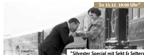
So 31.12. 19:00 Uhr*

Branaghs opulente Neuverfilmung des berühmten Krimiklassikers kann es mit Sidney Lumets legendärer Adaption aufnehmen! Was als verschwenderische Zugfahrt durch Europa beginnt, entwickelt sich schnell zu einer der stillvollsten, spannendsten und aufregendsten Mysterien, die je erzählt wurden. Basierend auf dem Buch der Bestsellerautorin Agatha Christie , erzählt Mord im Orient Express die Geschichte von dreizehn Fremden in einem Zug, von denen jeder ein Verdächtiger ist. Ein Mann muss gegen die Zeit ankämpfen, das Rätsel zu lösen, bevor der Mörder noch einmal zuschlägt. Klassische Krimiunterhaltung vom Feinsten.